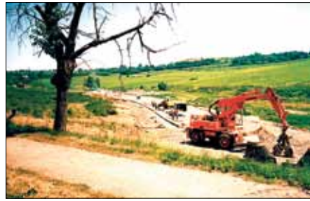
Schaffung eines Gewerbegebietes in Ahlsdorf