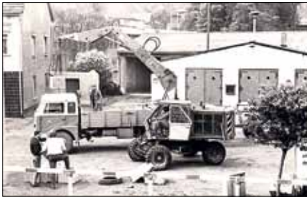
Neugestaltung des Lindenplatzes in Ahlsdorf