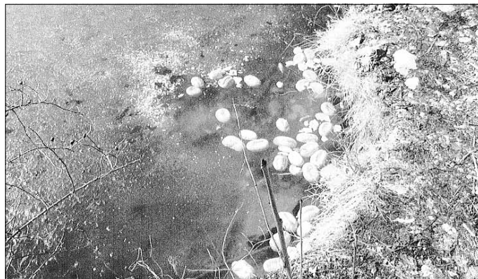
„Brötchenentsorgung“ im Gewässer Bad-Anna in Helbra

Auch durch die Fischereibehörde wurde dies schon in den vorhergehenden Jahren festgestellt und kritisiert.