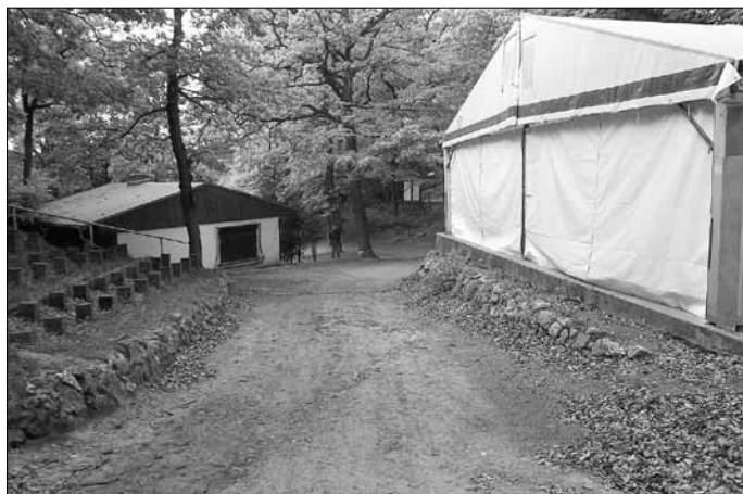
Nach Pfingsten kann mit der Umgestaltung im Katharinenholz begonnen werden