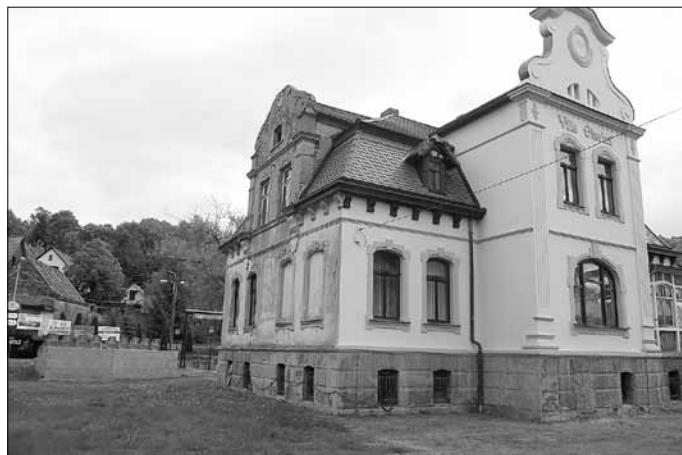
In Kürze werden die Sanierungsarbeiten an der Fassade der „Villa Oberhof“ durchgeführt