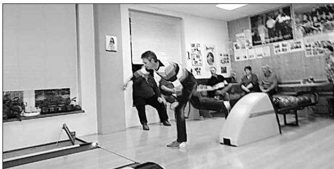
Der Schatzmeister des Vereins in Aktion

Es war alles in allem ein gelungener Abend.